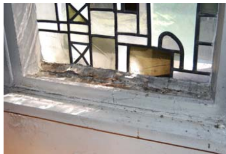
Fenstertriptychon und Detail Schadensbild

Die Restaurierung der Fenster in der Christuskirche Eidelstedt wird unterstützt.