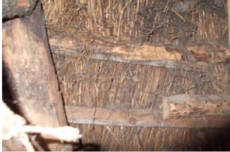
Reetdach vor Sanierung

Die Stiftung fördert die Sanierung des Reetdaches.