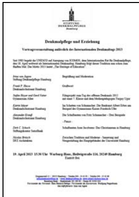
Vortragsveranstaltung anlässlich des Internationalen Denkmaltags

Die Stiftung veranstaltet den Internationalen Denkmaltag, der seit 1983 auf Anregung von ICOMOS, dem Internationalen Rat für Denkmalpflege, von der UNESCO für den 18. April weltweit ausgerufen worden ist. Aus diesem Anlass lud die Stiftung Denkmalpflege am 19. April zu einer Vortragsveranstaltung ins Warburg-Haus, die unter dem Jahresmotto der UNESCO „Denkmalpflege und Erziehung“ stattfand. Die gut besuchte Veranstaltung mit fünf Vorträgen bot ein Forum zum Gedankenaustausch von Vertretern der Schulen und von Schulbau Hamburg mit den Denkmalpflegern.