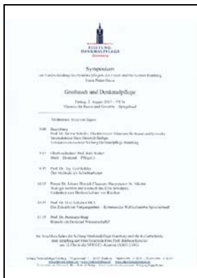
Symposium zur Verabschiedung des Denkmalpflegers der FHH