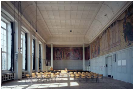
Aula der HFBK mit dem Gemäldefried „Die ewige Welle“

Die Stiftung fördert die Publikation Kunst | Bau | Kultur von Michael Diers zum Gebäude und dem von der Stiftung restaurierten Gemäldefries „Die ewige Welle“ von Willy von Beckerath.