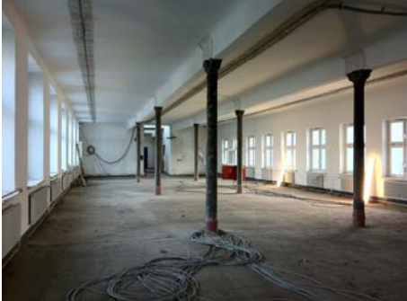
Eisenstützen Universitätsbibliothek, ehem. Pferdestall, Baustelle

Die Brandschutzmaßnahmen an den gusseisernen Stützen im ehemaligen Pferdestall werden von der Stiftung gefördert.