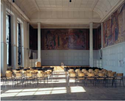
Aula vor der Restaurierung

Für die Restaurierung der Aula, insbesondere im Bereich Messingdekor-, Metallbau und Reinigungsarbeiten sowie im Bereich Dekor-Malerarbeiten wird eine Förderung zur Verfügung gestellt. Die Förderung erfolgt im Rahmen eines Matching-Funds zur Aufstockung einer an die Stiftung gegangenen privaten Spende in gleicher Höhe.