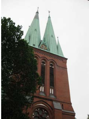
Ansicht Turm

Die Stiftung gewährt für die Sanierung der Fugen und den partiellen Austausch von Steinen in der Turmfassade eine Förderung.