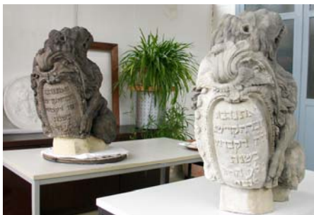
Das Original und einer der Abgüsse der Brunnenfigur des jüdischen Friedhofs in Altona

Die Brunnenfigur des jüdischen Friedhofs, ein 1736 geschaffener Sandsteinlöwe, seit dem 2. Weltkrieg im Altonaer Museum aufbewahrt, wurde mit Hilfe der Stiftung Denkmalpflege Hamburg restauriert und im Rahmen einer Pressekonferenz im Eduard Duckesz-Haus am 11.06.2013 der Jüdischen Gemeinde übergeben, die ihn dort als Ausstellungsstück belässt. Zudem konnten zwei Abgüsse angefertigt werden: Eine Kopie wurde auf der historischen Brunnenschale wieder am ehemaligen Eingang zum