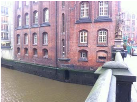
Fleetseitige Fassade vor der Sanierung

Die Stiftung unterstützt die Restaurierung und Wiederherstellung der fleetseitigen Fassade.