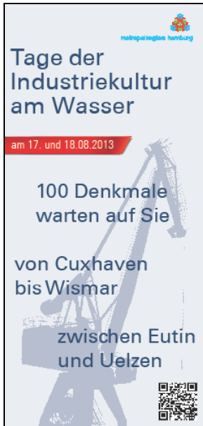
Programmheft Tage der Industriekultur am Wasser

Mit Hilfe der Stiftung Denkmalpflege konnten die Tage der Industriekultur am Wasser, die im Jahr 2011 erstmals unter der Ägide des Museumsdienstes stattfanden, gerettet und in die zweite Runde gebracht werden. Sie fanden am 17. und 18. August in der gesamten Metropolregion statt und boten den Bürgern Gelegenheit, über 100 Industriedenkmäler zu besichtigen. Mit Unterstützung der Stiftung wurden ein Katalog sowie ein Programmheft erstellt. Die Tage der Industriekultur fanden außerordentlich erfolgreich mit zahlreichen Besuchern statt und sollen nun auf der Basis der 2013 erarbeiteten Erweiterung regelmäßig alle zwei Jahre wiederholt werden.